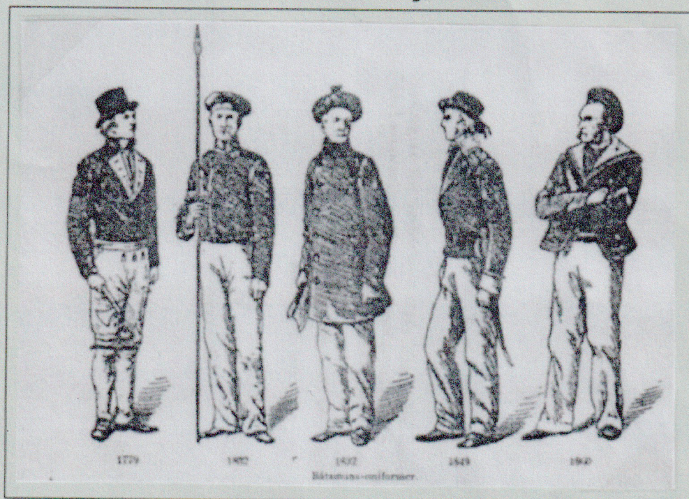
Postföring inom båtmannakompanier Båtsmanna-uniformer

Vid 1887-års riksdagsbeslut började avvecklingen av båtsmanshållet. Detta hindrade inte, att man 1895 utgav en "Instruktion för båtmannakompanier uppföring vid allmän mobilisering". Formulär 1, 2, 3a utgör själva inkallelseordern, och formulär 1, 2, 3b omslag, kuverten