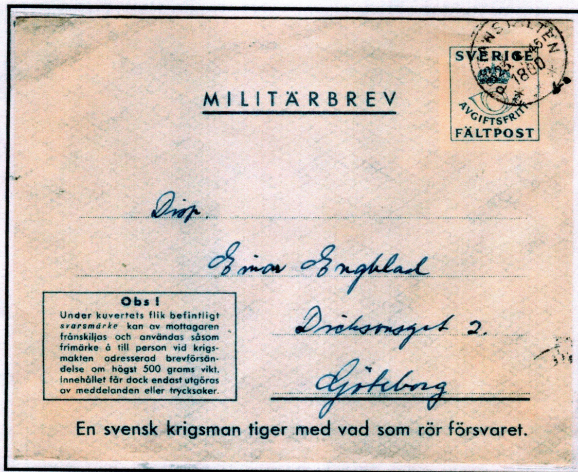
1945. Militärbrev M 11A, POSTANSTALTEN 1800 * * * Reservnummer LÅNGEDRAG Avsant från Marinpost 2232 A Stämplat POSTANSTALTEN 1800 * * * (Långedrag) den 23.4.45 till GÖTEBORG

Marinpost 2232 A Marindistrikt väst (MDV), Göteborgs kustartilleriförsvär spärren Galtö.