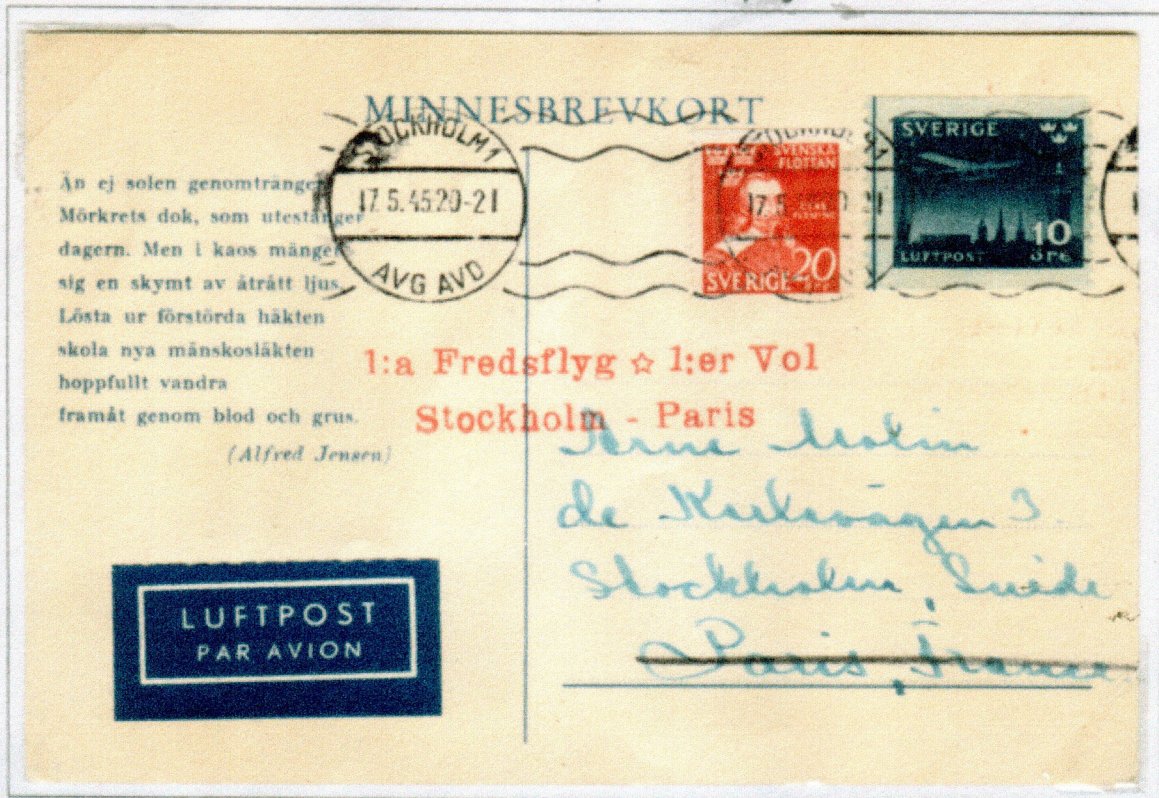
1945. Minnesbrevkort sänt som luftpost, 1:a fredsflyget STOCKHOLM - PARIS den 17.5.45