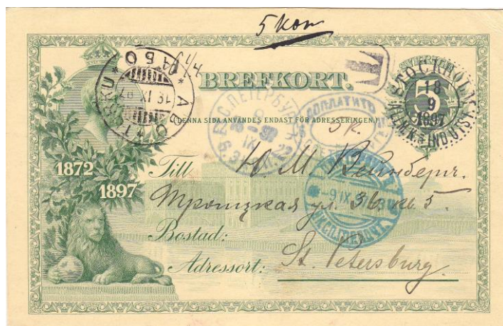
Bild 3: Kort till Ryssland, Stockholm 18/9 1897 – Åbo 18/9 1897 – – St. Petersburg 9/9 1897 (21/9 enligt den gregorianska kalendern).

Bild 3 visar också ett exempel på fall A. Kortet är skickat till Ryssland utan någon tilläggsfrankering, och lösenbelagt. Posten har slagit en T-stämpel ( Taxe à payer , den franska beteckningen för lösen) och noterat 6¼ vilket står för felande porto i franska centimes. Detta motsvarade 5 öre, vilket visar att man taxerat kortet som brevkort och accepterat valörstämpeln. I Ryssland har kortet lösenbelagts med 5 kopek vilket motsvarade dubbelt felande porto.