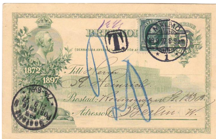
Bild 6: Kort till Tyskland, Malmö 19/9 1897 – (Berlin) Bestellt vom Postamte 9 21/9 1897.