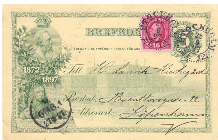
Bild 7: Kort till Danmark, Stockholm 25/9 1897 – (Köpenhamn) V Omb. 1 27/9 1897.

Fall D, slutligen, innebär att kortet taxerades som brev och att valörstämpeln inte räknades med i portot. Bild 7 visar ett sådant kort till Danmark som frankerats med 10 öres porto – det brevporto som gällde inom Skandinavien.