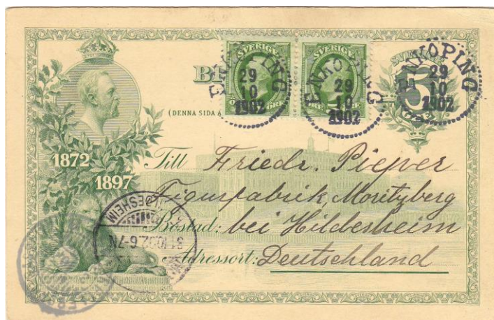
Bild 4: Kort till Tyskland, Enköping 29/10 1902 – – Trelleborg-Sassnitz 31/10 1902 – Moritzberg 31/10 1902.

Bild 4 är ett exempel på fall B. Kortet är skickat till Tyskland och uppfrankerat med 10 öre. Det är alltså taxerat som brevkort, men den påtryckta valörstämpeln har inte ansetts giltig som porto.