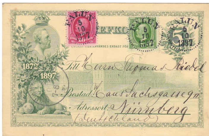
Bild 5: Kort till Tyskland: Falun 5/10 1897 – Nuernberg 7/10 1897.

Bild 5 illustrerar fall C. Kortet har betraktats som frankeringsgiltigt, dvs. valörstämpeln på 5 öre har räknats in i portot. Däremot har det taxerats som brev, inte brevkort. När det skickades till Tyskland krävdes därför uppfrankering med 15 öre till 20 öres utrikes brevporto.