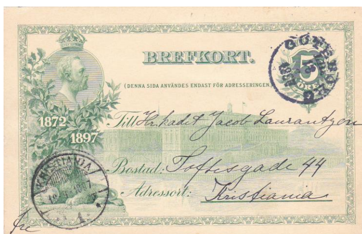
Bild 1: Kort till Norge, Göteborg 18/9 1897 – Kristiania 19/9 1897.

Samtidigt hade svenska postverket redan 1896 börjat planera för någon form av minnesutgåva med anledning av Oscar II:s jubileum. När man till slut bestämde sig för att ge ut ett brevkort – trots Washingtonkongressens beslut – fick man därför i det cirkulär som kungjorde utgåvan tala om att kortet var ” afsedt allenast för inrikes korrespondens ”. 2